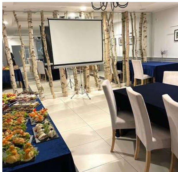
Sala Leśna Kraina - do 90 osób