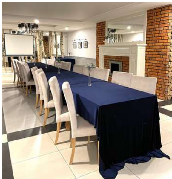
Sala Leśna - do 30 osób

Wynajem sali konferencyjnej: koszt ustalany indywidualnie, w zależności od wyboru sali i ilości osób