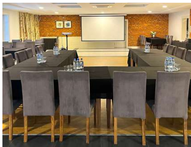
Sala Leśne Ustronie - do 200 osób